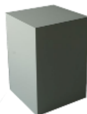
> AR163 > AR164 > AR165